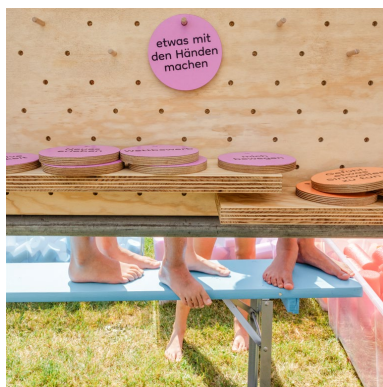
06 Foto: John T. Simpson © Zentrum Paul Klee