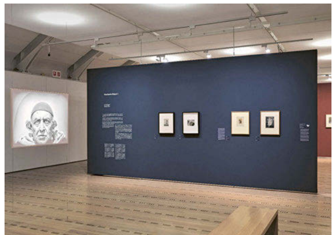
Ausstellungsansichten: Rolf Siegenthaler