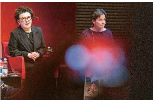
Olga Tokarczuk

Das Zentrum Paul Klee legte seinen Fokus an der Museumsnacht auf Familien und Kinder. Neben den Ausstellungen Joan Miró. Neue Horizonte und Paul Klee. Vom Rausch der Technik konnten sich Besucher:innen an Kinderliedern der Badwanne Pirate, abenteuerlichen Klangobjekten von Tönstör und einer surrealen Feueranimation erfreuen. Im Kindermuseum Creaviva lief die Interaktive Ausstellung La pintura. Wir sind Farbe . Dazu entstand ein Gemeinschaftswerk, von dem jede:r ein Teil mit nach Hause nehmen konnte. Als besonderer Höhepunkt fand im Zentrum Paul Klee die «erste virtuelle Lesung der Welt» statt und Special Guest Sälvädör Däli (#CHunsCHt?) zauberte Musik in die Ohren und ein Lachen auf die Lippen.