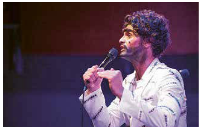
Sälvädör Däli