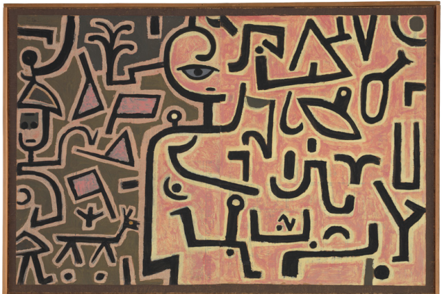
Paul Klee, Vorhaben (1938). Zentrum Paul Klee, Bern

Teil des gesellschaftlichen Engagements der Migros-Gruppe: migros-engagement.ch